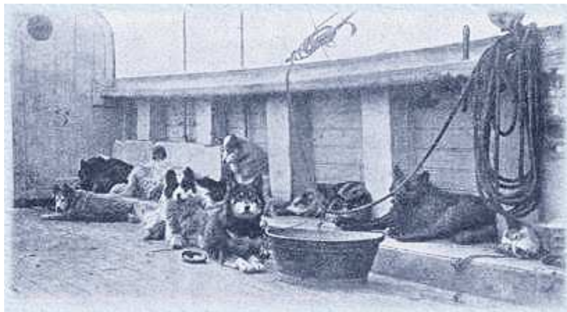
Een aantal honden wordt mee genomen naar Italië